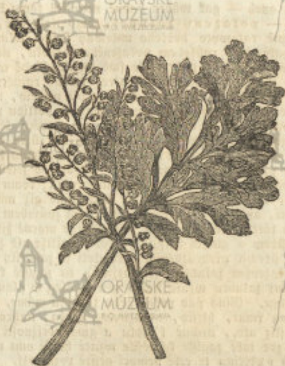
(P e l j n ě t.)

ulewy horší se. Proti trvavým křečím u dětí a mladých autlych často již dobře posloužil. A tomuto účelu pozdě na podzim se musí sbírat, když se gen ošlepari, nikoli však myti. A.